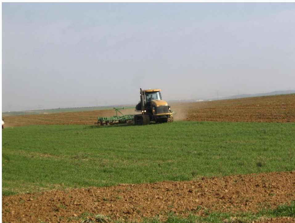
חריש שטחים בדואים מעובדים באלעראקיב, 2006

כמו כן, לצד הריסת בתים הממשלה נקטה באמצעים שונים הפוגעים בסביבה באופן חמור. אחת השיטות האלה השמדת שטחים חקלאיים רחבים, שעובדו בקרקעות הנתבעות על ידי הבדואים, על ידי ריסוסם בחומר כימי מהאוויר. עדאלה הצליחה לעצור תהליך זה בבית המשפט (בג"ץ 2887/2004). אך המדינה מצאה דרך "יצירתית" חדשה להשמדת היבולים ע"י חריש הקרקע המעובדת.