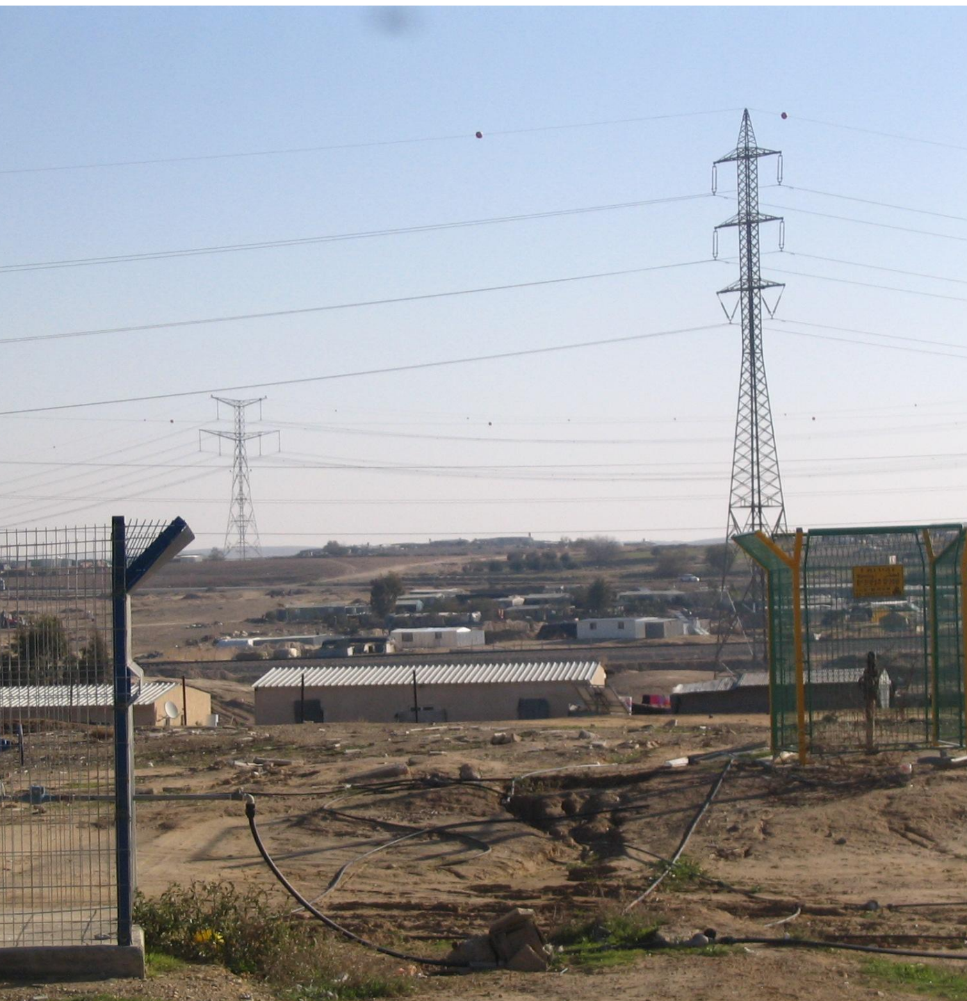
צינור המספק מים בקוטר צול לתושבים בכפר אלסר 2011

לאחרונה ובעקבות פניית עדאלה (9535/2006) חייב בג"ץ את המדינה "להבטיח נגישות מינימאלית" של תושבי שלושת הכפרים לא מוכרים: אום אלחיראן, תל עראד ואלקטאמאת.