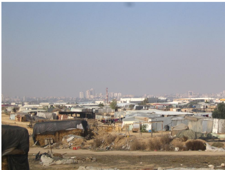
הכפר הלא מוכר אלסר על רקע העיר באר שבע